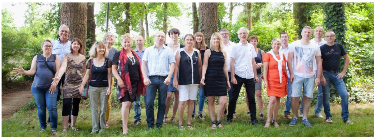
Une partie de l'équipe Imprigraph

Les 7 et 8 juillet derniers, les salariés des Scop IOV communication (56) et Le Sillon (44) approuvaient la création de la Scop Imprigraph lors de leurs Assemblées générales respectives. Cette nouvelle structure va permettre aux deux entreprises, spécialisées dans la création graphique et l'imprimerie, de se donner les moyens de se développer et d'investir, dans un secteur en pleine mutation.