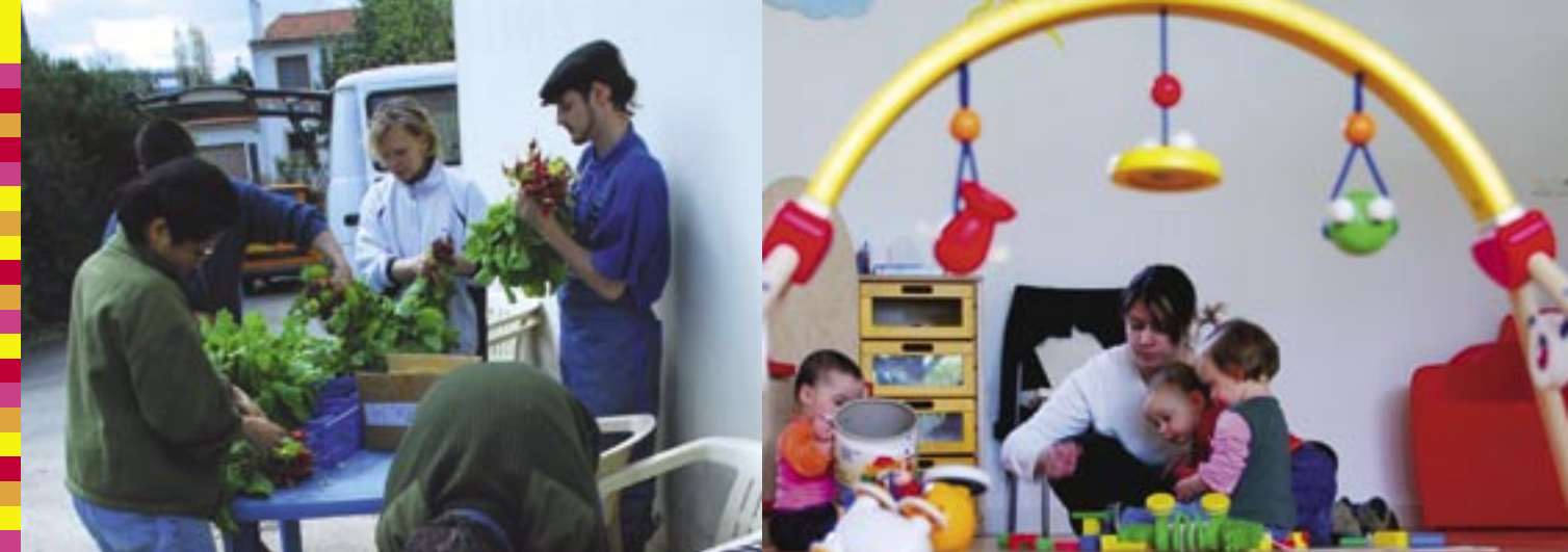
Les écosolies Journées d'études et de mobilisation de l'économie sociale et solidaire