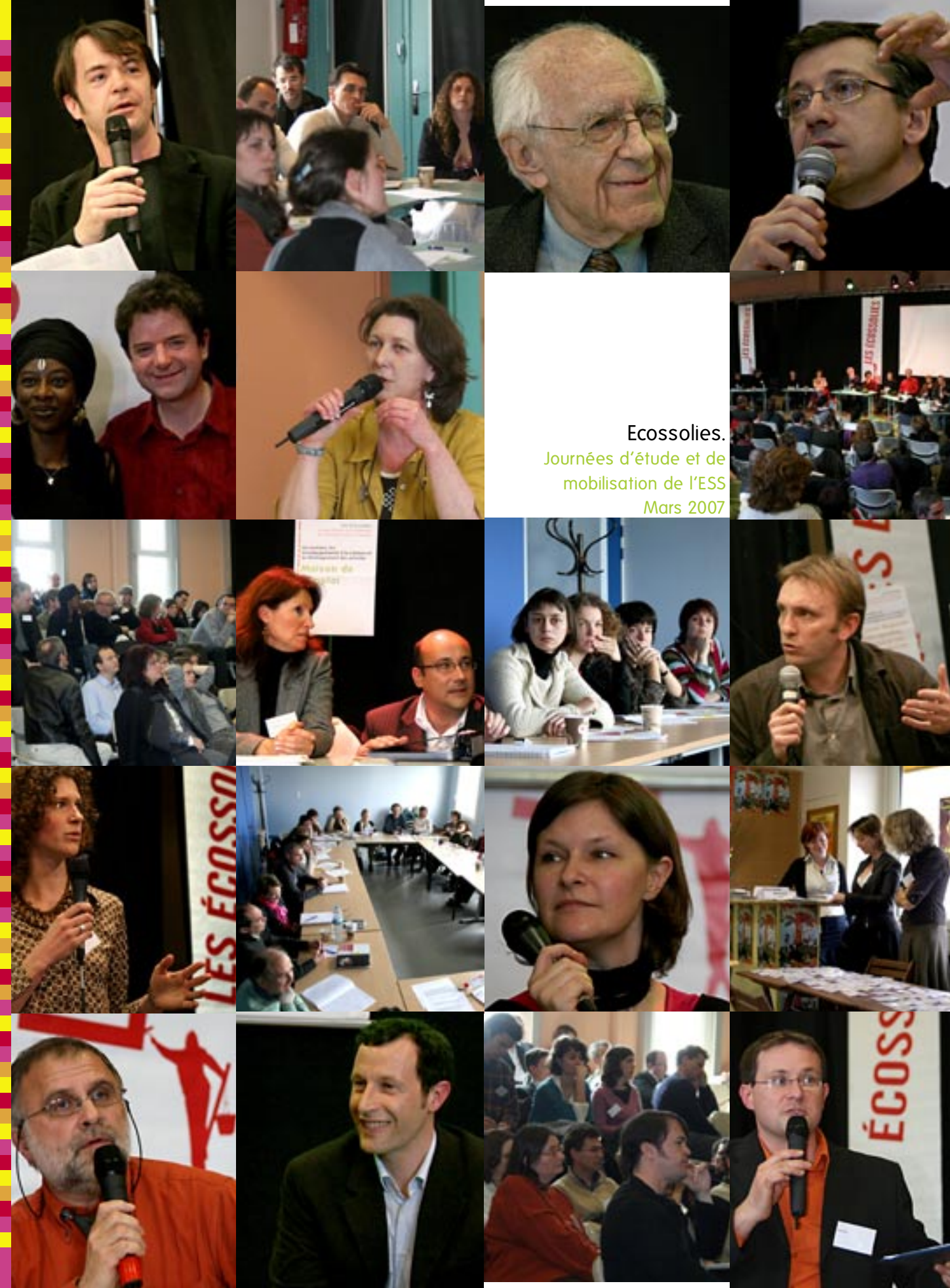
Ecosolies. Journées d'étude et de mobilisation de l'ESS Mars 2007