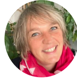
xxx •x xx •@ecossolies.fr